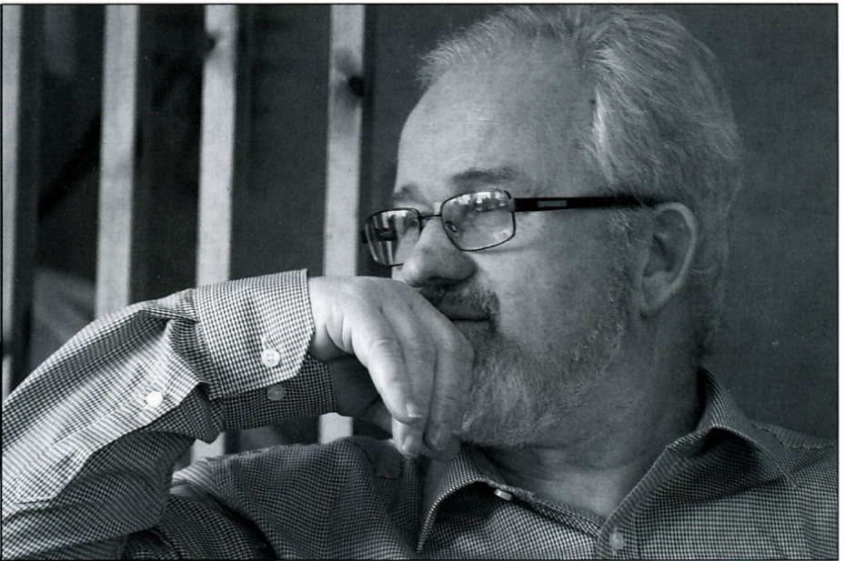
Jag minns att många europeiska länder ville köpa vårt utbildningsmaterial.