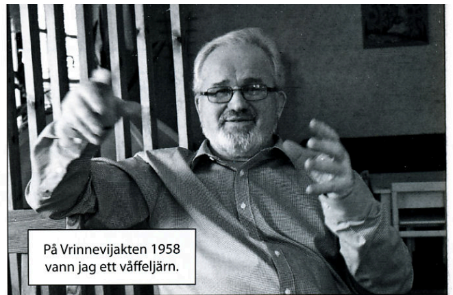
På Vrinnevikjakten 1958 vann jag ett väffeljärn.

- Ja nu blir det några år med bland annat Eneby Bollklubb där vi nyligen byggt en inomhushall för fotboll med mätten 77x40 meter med konstgräs och just nu håller på med att dra in fjärrvärme och vi kommer också att bygga till en kanslibyggnad så det finns att göra. Sedan har jag faktiskt sagt att jag skall börja skjuta igen även om inte så många verkar tro mig, vi får väl se vem som får rätt.