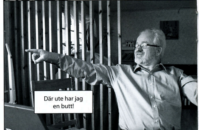
Där ute har jag en butt!

Jag har till och med skaffat mig en ny fristilsbåge. Jag kommer att växla lite mellan fristil och långbåge. Det är helt olika syften för mig, fristilen blir lite mer allvar medan långbåge för mig mer handlar om Back to Basic. Jag sköt ju min första tävling redan 1958 så jag har ju hållit på ett tag. Så om jag inte träffar med varenda pil i långbåge då kan jag ta det men missar jag en fristilspil då blir jag irriterad. Jag kommer att göra comeback i år och jag vill utnyttja sommarhalvåret ute i stugan där jag kan ha bågen stående klar. Då är det bara att haka på strängen och skjuta.