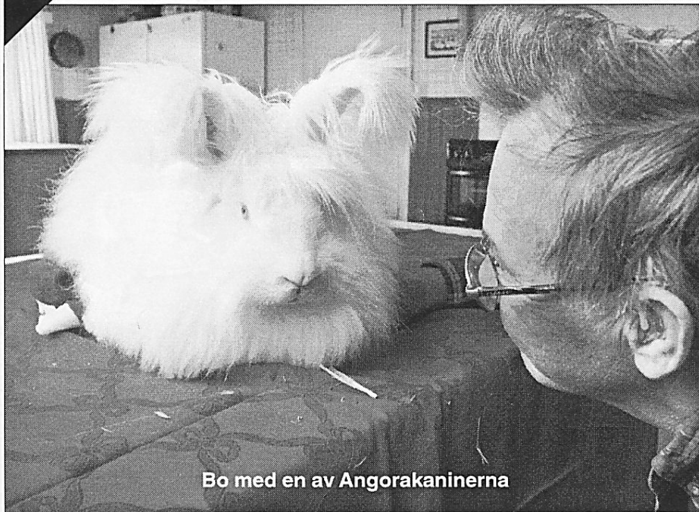
Bo med en av Angorakaninerna