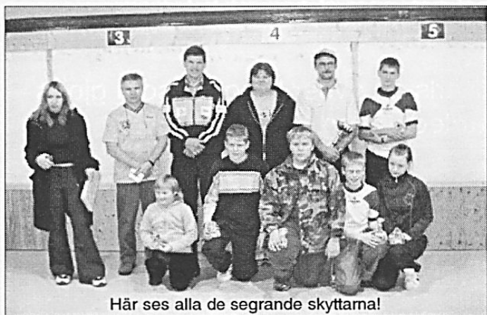
Här ses alla de segrande skyttarna!