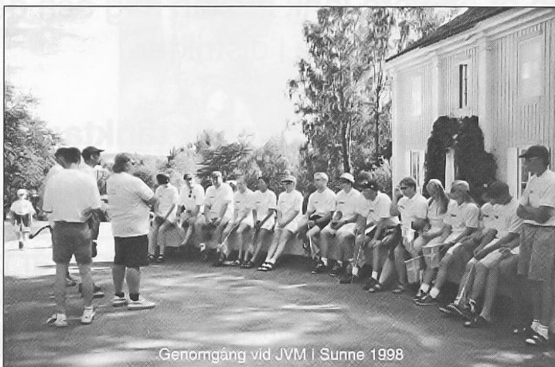
Genomgång vid JVM i Sunne 1998

- Stressad blir alla människor, så naturligtvis även jag. Men sedan så tror jag att om man tycker att något är roligt och man gör sakerna av stort eget intresse så klarar man det bättre. Skulle det kännas som något man blir påtvingad då skulle det nog