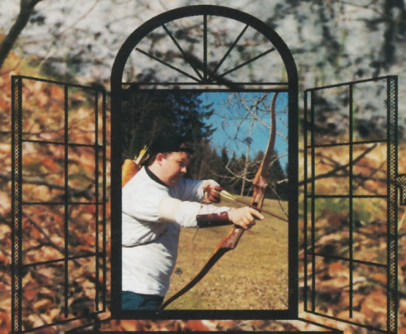
Stora omslagsbilden: Rolf-Arne Kulle